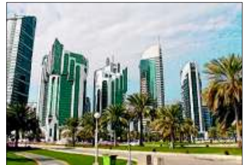
In Doha gibt es immer mehr Wolkenkratzer ...