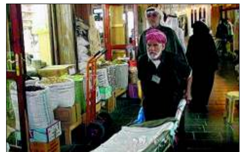
... doch die Altstadt ist geliebt wie früher